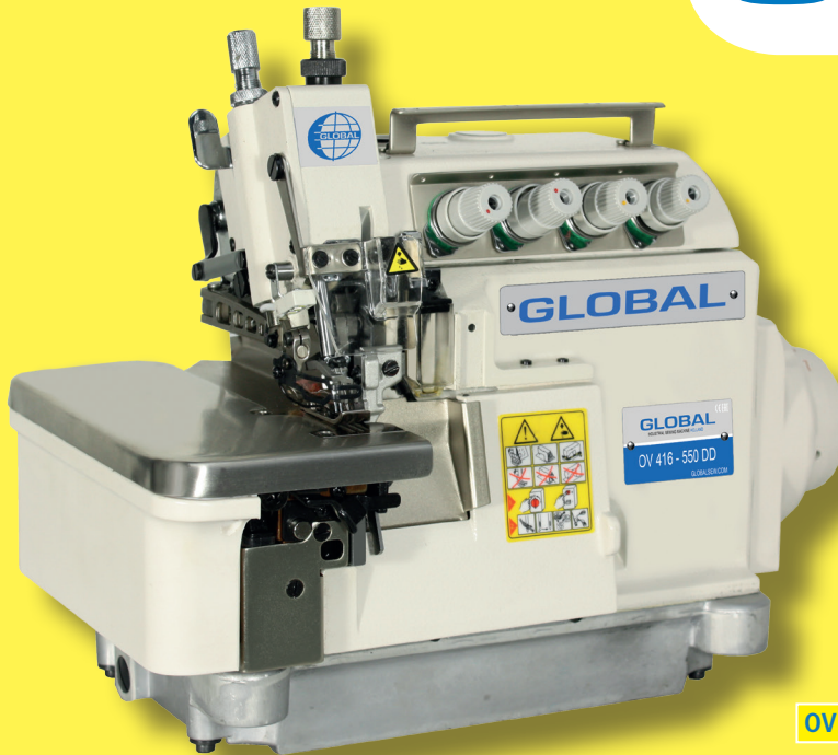
OV 416-550 DD