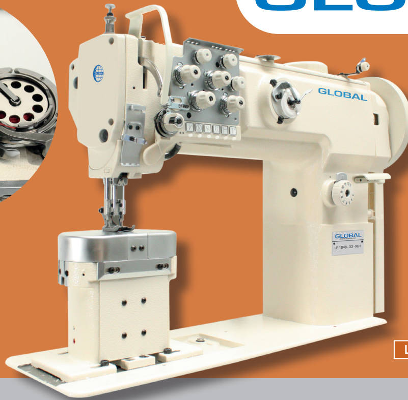
LP 1646-33 XLH