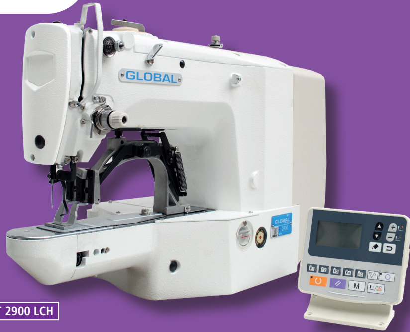
BT 2900 LCH