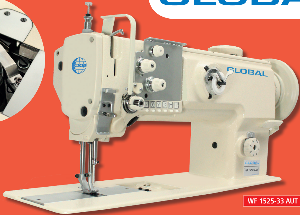
WF 1525-33 AUT