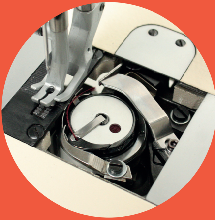
WF 1525-33 AUT