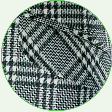
Slant pocket men's wear (PW 2045 SP)