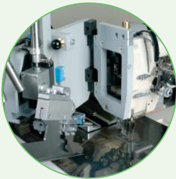
Head tilted back for quick and simple servicing and maintenance.