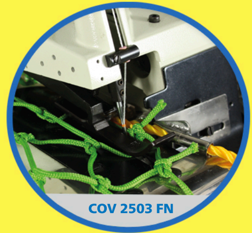
COV 2503 FN