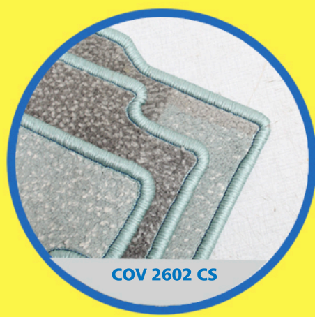
COV 2602 CS