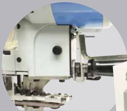
DISCONNECT SECURITY SWITCH