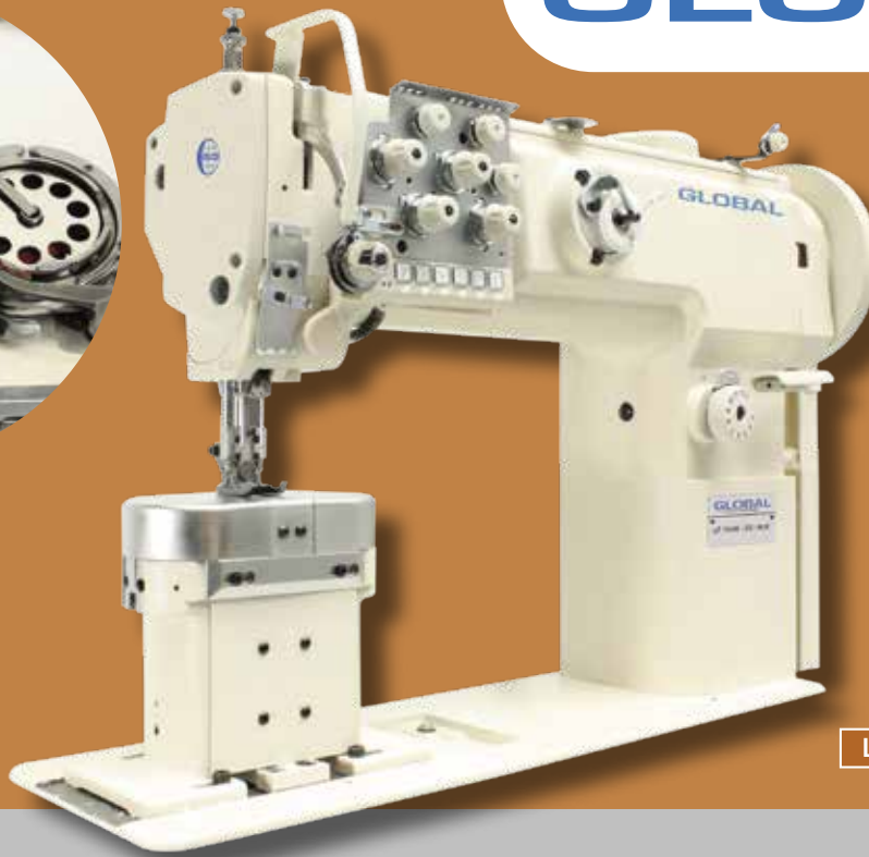
LP 1646-33 XLH