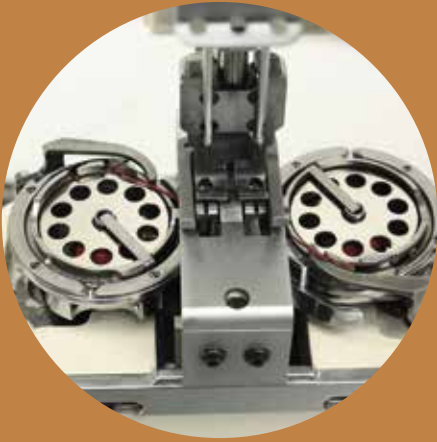
LP 1646-33 XLH