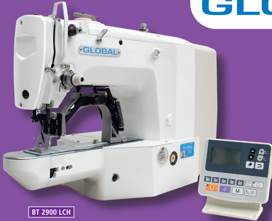
BT 2900 LCH