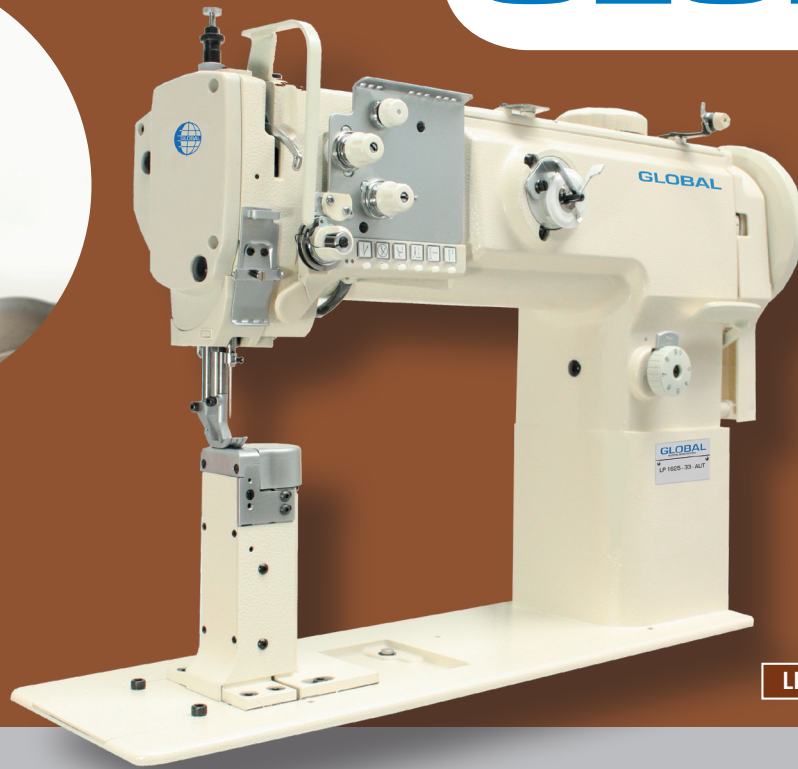
LP 1625-33 AUT