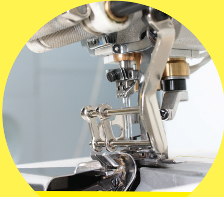
FB 3653-56 TMD