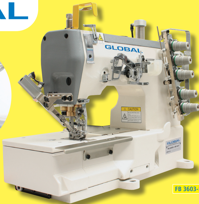
FB 3603-56 AUT