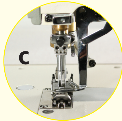
FB 3603-64 BFC-DD COVERSEAM OPERATION